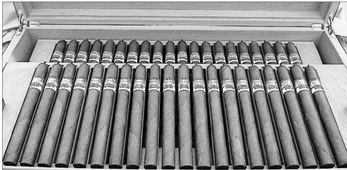
Caja de puros Cohiba Behike que Altadis ha lanzado al mercado.